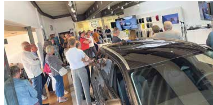
Experiment gelungen: Die virtuelle Modelleinführung des Volvo EX30 war ein Novum – immerhin wurden insgesamt 70 Personen, darunter auch einige Bröhan-Mitarbeiter, Zeuge der Übertragung aus Mailand.

wurde hier ein Mini-SUV konstruiert.“ Dass vergleichsweise kleine E-Autos ideal in der Stadt eingesetzt werden können, weil dort kurze Strecken an der Tagesordnung sind, liegt auf der Hand. Anders ist es im ländlichen Bereich, wo häufig große Strecken bewältigt werden müssen. Hier könnte der EX30 aber zumindest bei der Entscheidung über einen Zweitwagen eine Rolle spielen. Die Reichweite liegt nach Herstellerangaben je nach Akku bei 344 bis 480 Kilometern. Der EX30 startet bei 272 PS und bringt in der stärksten Version 428 PS auf die Straße. Schmand-Bröhan: „Damit ist man in 3,6 Sekunden von Null auf 100. Der EX30 ist der schnellste Volvo aller Zeiten.“ Das beeindruckte offenbar auch die Bröhan-Kunden, die virtuell auf Tuchfühlung gingen. „Das Echo war durchweg positiv. Es gab vereinzelt sogar ‚Bestell ich‘-Zwischenrufe.“ Die Stimmung sei toll gewesen. Beim anschließenden Treff in der warmen Abendsonne am Foodtruck durfte dann ausgiebig diskutiert werden. Der EX30 kann ab sofort bestellt werden. wb