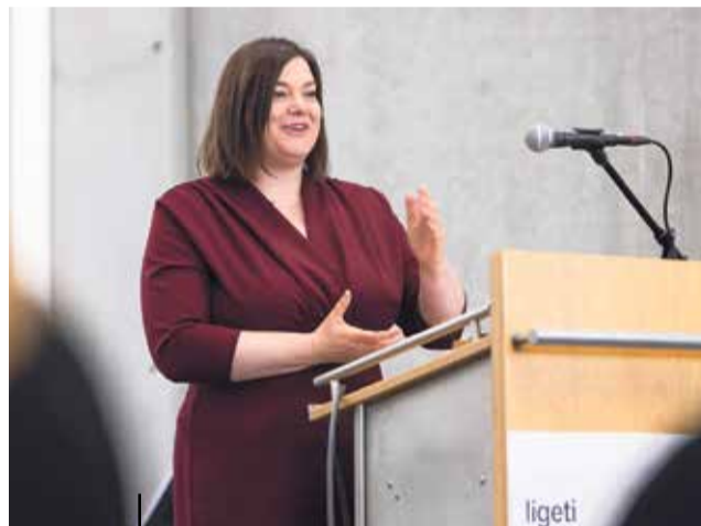
Hamburgs zweite Bürgermeisterin und Wissenschaftssenatorin Katharina Fegebank freut sich über den interdisziplinären Ansatz des ligeti zentrums, an dem vier Universitäten beteiligt sind.

ligeti zentrum in Harburg eröffnet – Im Kaispeicher machen vier Universitäten interdisziplinär gemeinsame Sache