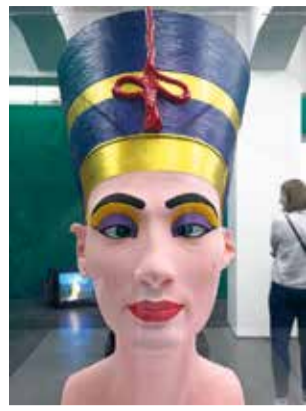
Ein künstlerischer Affront gegen die berühmteste Ägypterin: die schielende Nofretete.

Interessiert? Hier gibt es mehr Informationen: https://www.kiekeberg-museum.de/das-sind-wir/ehrenamt/