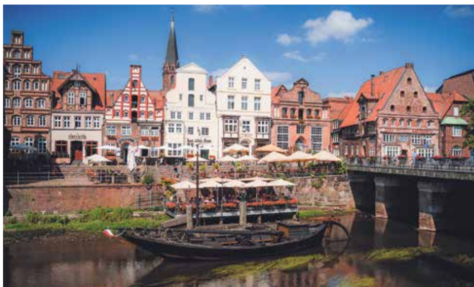
Typisch Lüneburg: Der Stint-Hafen ist beliebtes Ziel für Stadtbesucher und Einheimische.