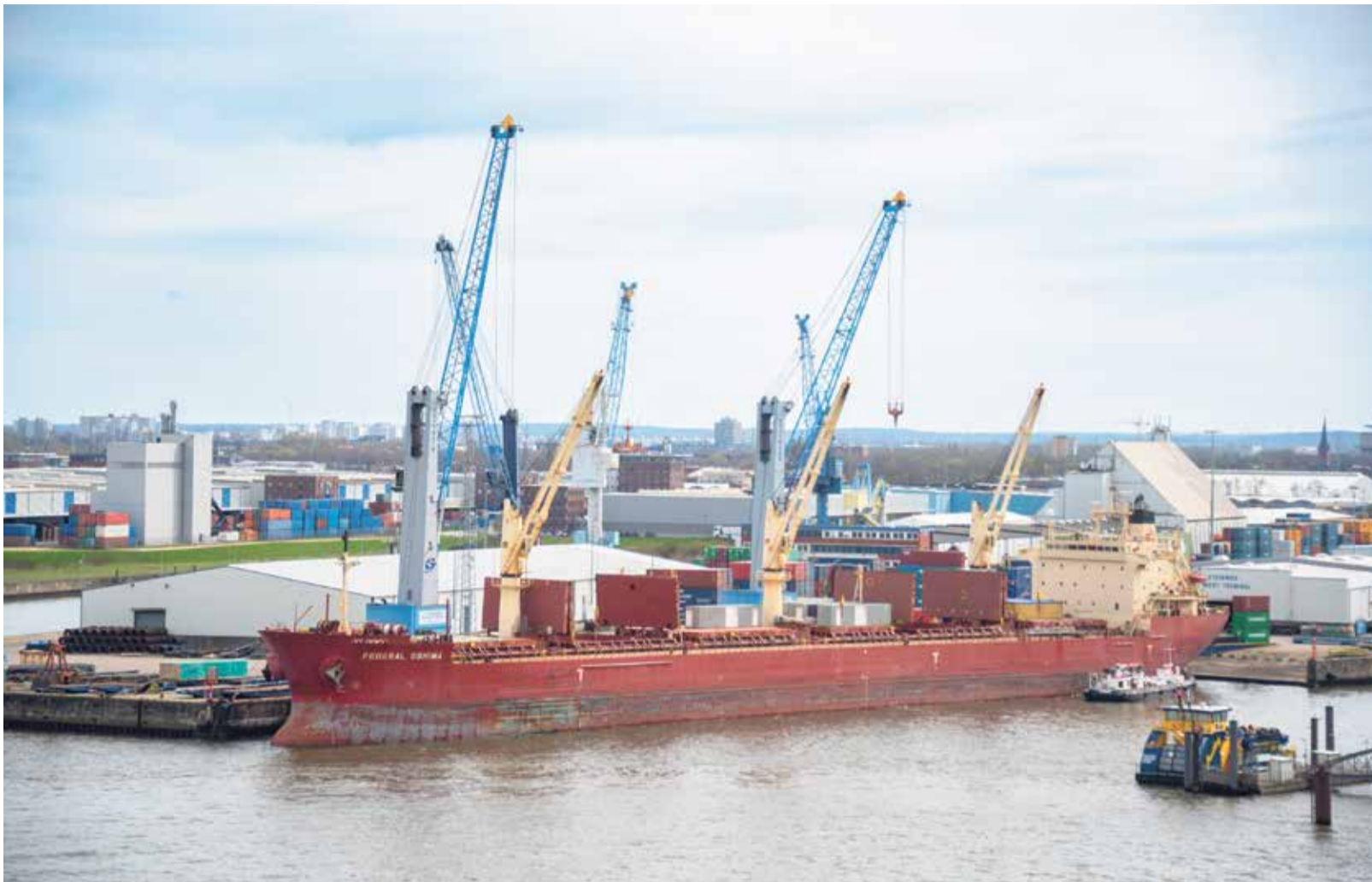
Die Verkehre mit den USA setzen positive Akzente im See-Containerverkehr über den Hamburger Hafen.