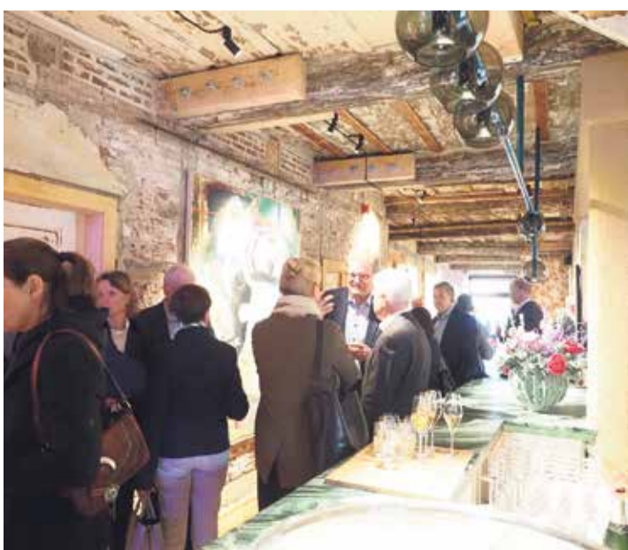
450 Spots setzen die Bilder in Szene. Die Galerie ist zum Start auf das Erdgeschoss begrenzt. In den oberen Etagen sollen auch Konferenzräume angeboten werden.