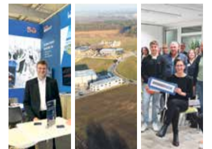
JUBILÄUM 25 Jahre WLH – Die drei Säulen der Wirtschaftsförderung Seite 29

KI sind – und was passiert, wenn diese Technologie in falsche Hände gerät. Oder ist sie es nicht längst? Im Bereich Wirtschaft und Wissenschaft steht das Thema auch im Hamburger Süden ganz oben auf der Agenda. Das Tempowerk hat sich bereits positioniert und plant einen „KI-Brückenkopf“ Richtung Norden. Dort hat das Artificial Intelligence Center Hamburg e.V., ein Kooperationspartner des Tempowerks, seit 2019 ein großes Netzwerk von KI-Akteuren und Unternehmen aufgebaut. Die Türen der Experten stehen offen. Ungeachtet dessen sorgt der Textgenerator ChatGPT für allerlei Verwirrung – beispielsweise an Schulen. Hauptproblem: Wie sollen Leser von Texten oder Betrachter von Bildern künftig noch entscheiden, was falsch und richtig beziehungsweise was von Menschen erdacht oder von Maschinen erzeugt wurde, wenn KI-Inhalte nicht gekennzeichnet sind. Der verantwortungsvolle Umgang mit KI rückt immer stärker in den Fokus. Aufträge wie „Schreibe mir ein Glossar zum Thema KI“ erledigt ChatGPT lediglich gut – ein harmloser Beitrag (nachzulesen auf Seite 4). Der Bot liefert allerdings auch Predigten, Aufsätze, Studienarbeiten und Anleitungen zum Bau von Molotow-Cocktails, wenn man ihn geschickt befragt. Was kommt da auf uns zu? Ausführliche Berichte und Kommentare auf den Seiten 3 bis 9.