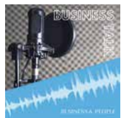
PODCAST Zwölf Folgen des B&P-BusinessTalk finden sich in dieser Ausgabe, darunter drei Video-Podcasts der Serie „Wir sind Kiekeberg“ (Seite 35) und drei spannende Gespräche aus dem Food-Themenbereich (Seiten 19-22). QR-Code scannen und reinhören beziehungsweise anschauen.