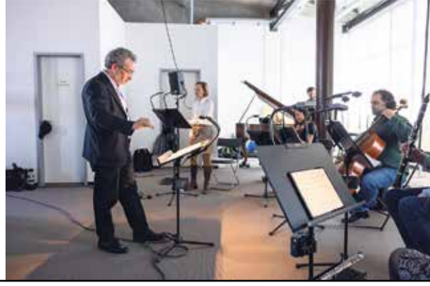
Die Multiverse Symphony – eine Komposition für Ensemble und Quantencomputer von Eduardo Miranda live vorge-tragen zur Eröffnung.