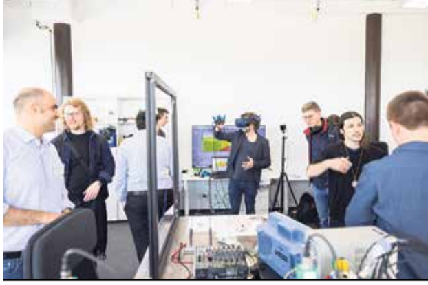
Hier wird's experimentell: Am Eröffnungstag bekamen die Besucher einen Vorgeschmack auf die Symbiose aus Musik, Technologie, Digitalisierung und Gesundheit (siehe auch Foto unten).