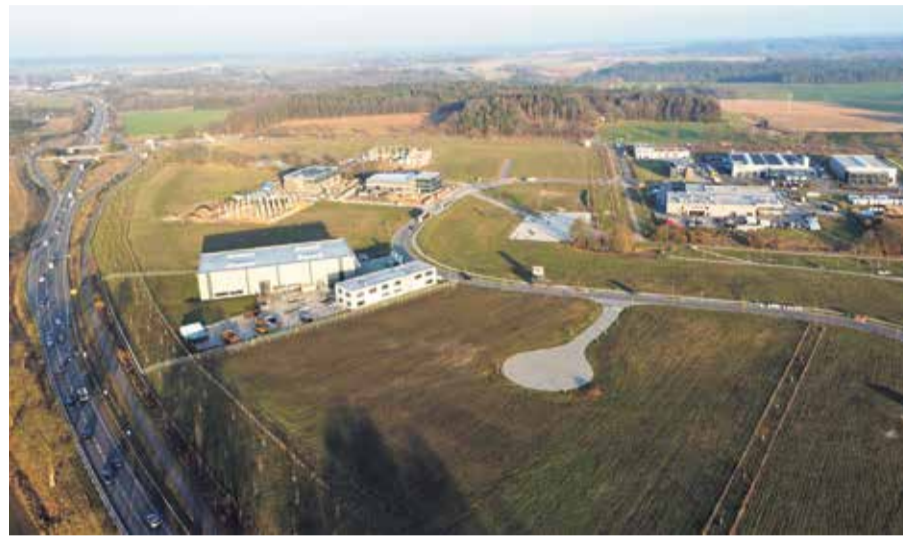
Hier wächst der TIP Innovationspark Nordheide in Buchholz – zugleich ein geschlossenes Test- und Forschungsfeld für die 5G-Anwendungen.

dungen übertragen werden soll. Die PHWT arbeitet beispielsweise daran, Virtuelle Realität in die Anwendung zu bringen. Der kabellose Einsatz von VR-Brillen ist ein Thema. Und dahinter verbirgt sich auch die Grundsatzfrage, die Timo Maurer formuliert: „Ist 5G-Technologie ein Gamechanger oder nicht?“ Will hei-