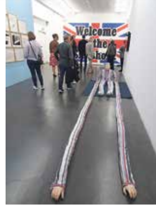
„Welcome to the shitshow“: Der Besuch der aktuellen Ausstellung bietet allerlei groteske Impulse aus der Welt der Kunst – wer Humor hat, sollte unbedingt mal reinschauen.